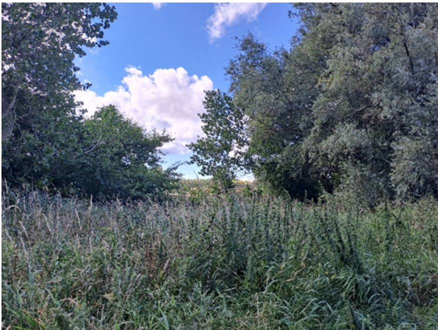
Foto af placering af ny markoverkørsel. Overkørslen placeres i den åbne korridor mellem træerne.

Vandløbet er uden slyngninger på strækningen og overkørslen ønskes etableret med plastrør i en bredde på ca. 9 meter. Bundbredden af Sørenden er blevet målt til 80 cm og det vurderes herudfra og fra besigtigelsen, at rørdiameteren skal være Ø80 cm.